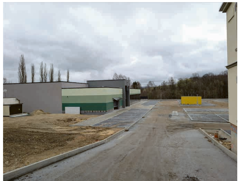
(fertiggestellter Edeka-Neubau in Schirgiswalde)

Sohland: Jörg Poremba und Peter Dittrich